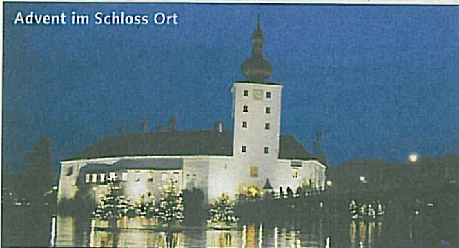
Advent im Schloss Ort