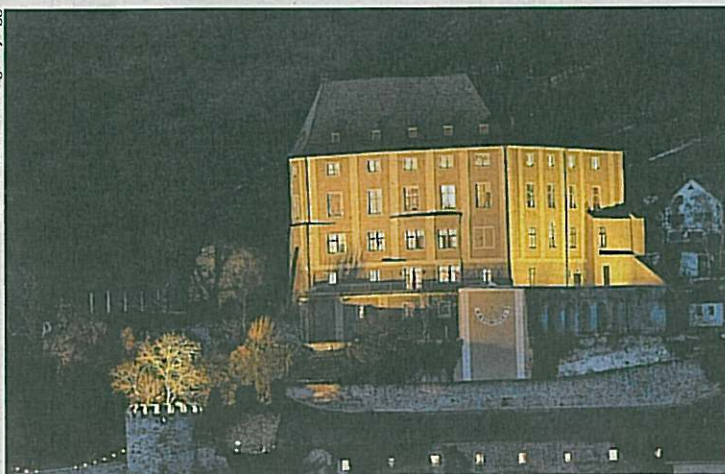
Schloss Steyregg öffnet sich für einen Weihnachtsmarkt