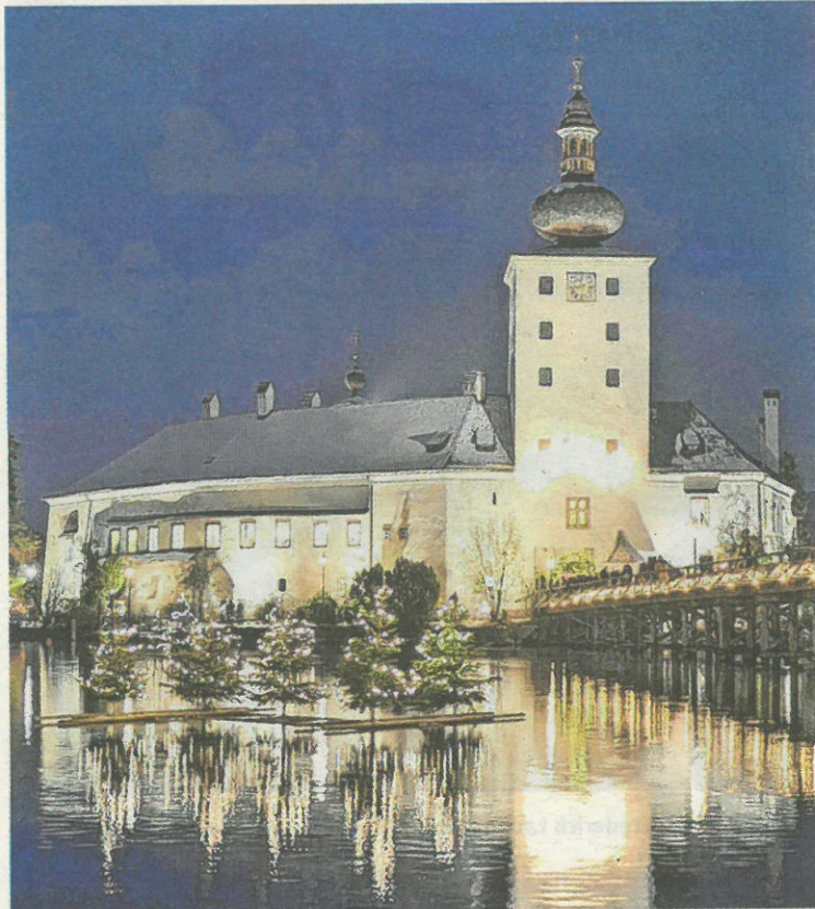
Das Lichtermeer in Gmunden erfreut Groß und Klein.

Für OÖNcard-Inhaber gibt es ein Schlösseradvent Keramikhäferl!