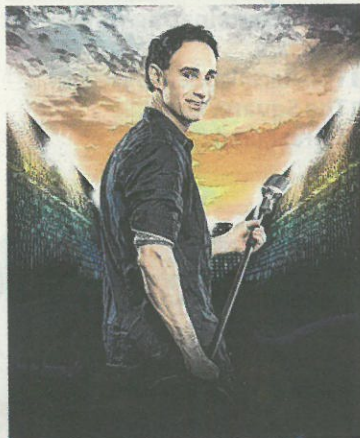
Auf dem Weg zum Olymp (Baumann)

Auf seinem Weg in den Comedy-Olymp warten auf Kulis hartnäckige Gegner: hilfsbereite Nachbarn, rosa Elefanten, verschollene Baumarkt-Mitarbeiter, die wilden Stiere von Pamplona,