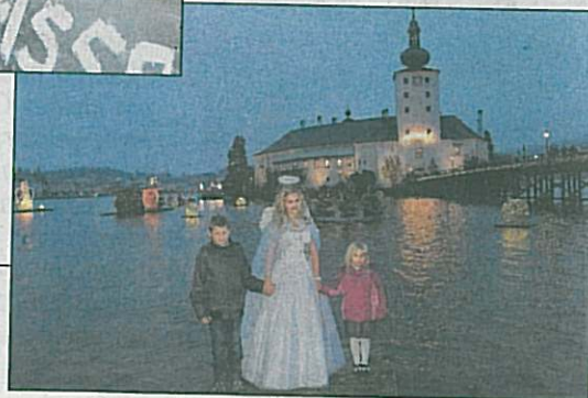
Der Schösseradvent in Gmunden bietet Romantik pur. ►