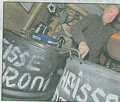
▲ Leckere Maroni stärken Besucher am Weinberger Advent in Kefermarkt.

Im Salzkammergut darf man sich den von der „Krone“ präsentierten Wolfgangsee Advent in Strobl, St. Wolfgang und St. Gilgen nicht entgehen lassen. Er hat auch an den kommenden Wochenenden geöffnet – wie auch der Schösseradvent in Gmunden und der Weihnachtsmarkt in Mondsee. Und in Linz oder auch in Wels laden die Weihnachtsstandln ja ohnehin täglich zum Besuch ein.