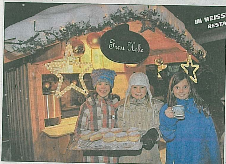
▲ Der von der „Krone“ präsentierte Wolfgangsee Advent präsentiert sich dieser Tage auch schon wunderschön verschneit. ►