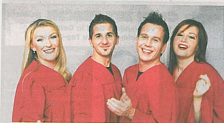
Die Vokalistinnen und eine perfekt eingespielte Band bieten exquisite Musik und mitreißende Stimmen-Power.

Vorverkauf bei der Oberbank und Raiffeisenbank Laakirchen. Die BezirksRundschau verlost 3 x 2 Karten, weitere Infos auf www.bezirksrundschau.com/salzkammergut . 414884