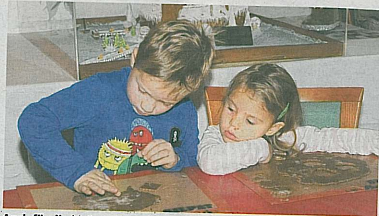
Auch für die kleinen Besucher gibt es ein buntes Programm.