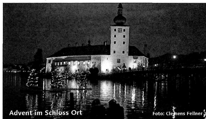
Advent im Schloss Ort