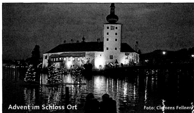
Advent im Schloss Ort